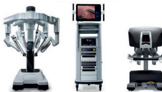
Figura 4-3. Robot Da Vinci Xi Intuitive.

La consola está conectada con la torre de control, sitio en el que se ubica la pantalla donde todo lo que el cirujano observa en su consola se transmite a un monitor para el resto del equipo quirúrgico que, a su vez, está visualizado de modo simultáneo el procedimiento y les permite interactuar y <<telestrear>> durante la cirugía; aquí es donde se conectan procedentes del carro con los brazos robóticos la cámara, los cables de energía monopolar bipolar y sellador de vasos, insuflador de CO 2 y grabador de la cirugía muy similar a las torres de laparoscopia convencionales. Por último, el carro con los brazos robóticos es el elemento que se acopla al paciente, y que puede moverse y cambiar de posición en la sala de quirófano para adaptarse a las necesidades de la cirugía; éste tiene cuatro brazos, en los cuales se ensamblan de 2 a 3 instrumentos de trabajo y el lente conectado a la cámara, el cual cuenta en su interior con dos lentes que proyectan imagen a cada ojo en alta definición, los cuales, al mezclarse en la consola del cirujano ofrecen la visión en 3D con excelente percepción de profundidad. Mientras el cirujano principal se encuentra en la consola realizando el procedimiento, el cirujano ayudante está en el carro con los brazos robóticos acoplados al paciente y es el encargado de